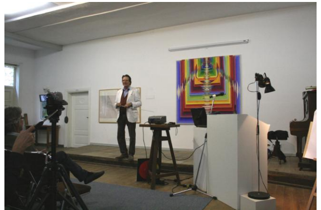
Walter Reimann: Symmetriemuster der Primzahlen