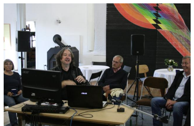
Burkhard Welzel: Elektronische Musik nach den Maßverhältnissen der Dorfkirche zu Hämerten