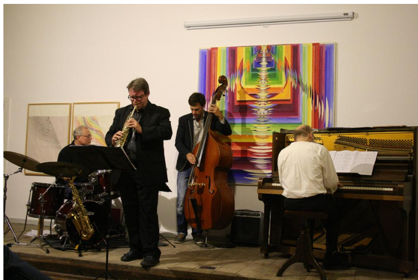
Jazzkonzert: Das AGvH-Jazzquartett