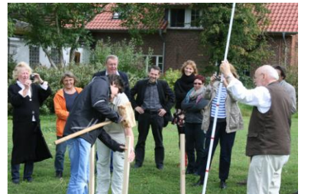
Ausschnürung des Grundrisses der Dorfkirche zu Hämerten